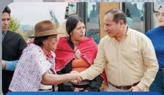
Baterías Sanitarias Estadio Wamanloma Salasaka