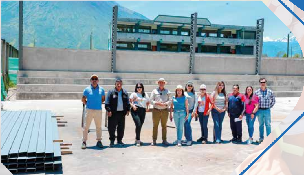
Construcción de cubierta de la cancha Unidad Educativa Cotaló