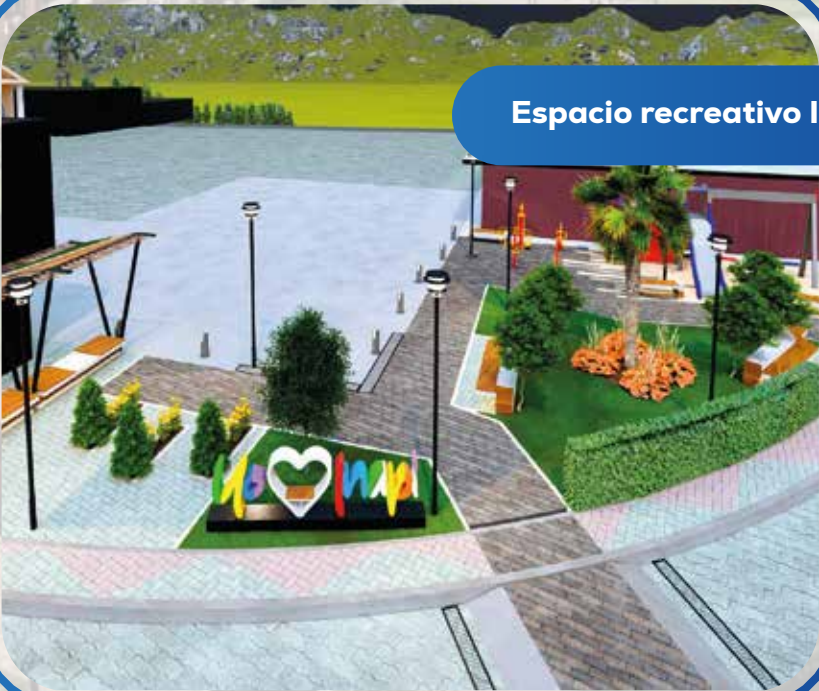
Espacio recreativo Inapí