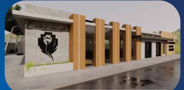
✓ CENTRO DE DESARROLLO INTEGRAL Y ESPACIO DEPORTIVO PAMATUG