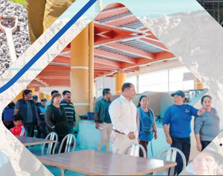
Camal Municipal Ampliación y readecuación de infraestructura, Mantenimiento de la planta de tratamiento