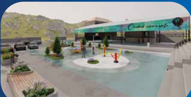
✓ CUBIERTA Y ESPACIOS DEPORTIVOS EL PINGUE