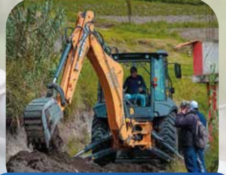
Construcción alcantarillado Parroquia Chiquicha

Bellavista, Chiquicha Chico y Bellavista