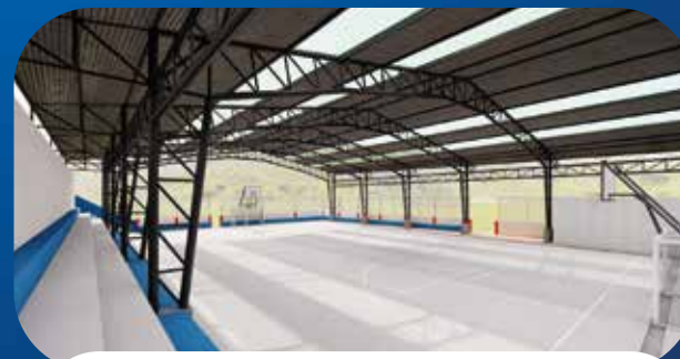
✓ CUBIERTA PLAZA BELLAVISTA DE LA PARROQUIA BOLÍVAR