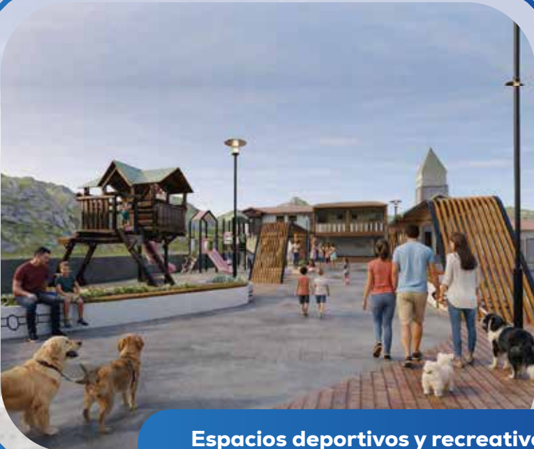
Espacios deportivos y recreativos Caserío Ladrillo