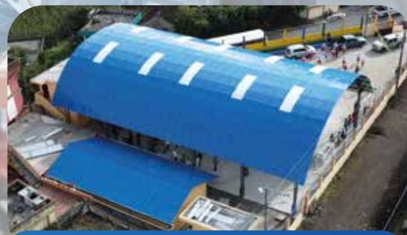
Cubierta cancha y mantenimiento Casa Comunal San José de las Queseras Cotaló