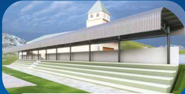
✓ CUBIERTA PARA EL GRADERÍO DEL SECTOR GAMBOA