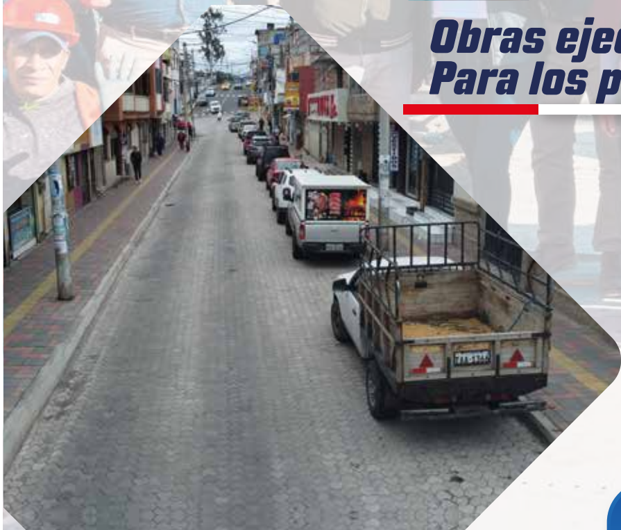
Adoquinado Varios sectores de Pelileo