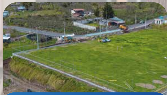
Construcción Cerramiento Estadio De Huasimpamba