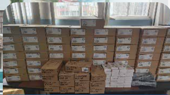
Radios de comunicación y Repuestos VHF