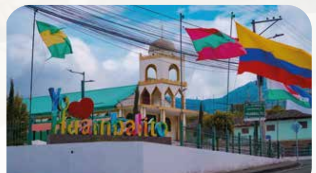
Mejoramiento Plaza de Huambalito