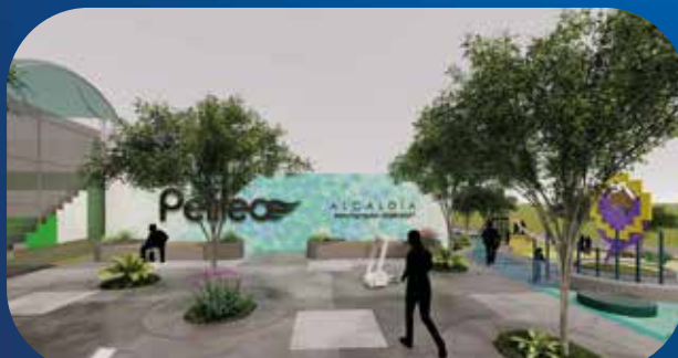
✓ REMODELACIÓN REPOTENCIACIÓN CANCHA SINTÉTICA MUNICIPAL