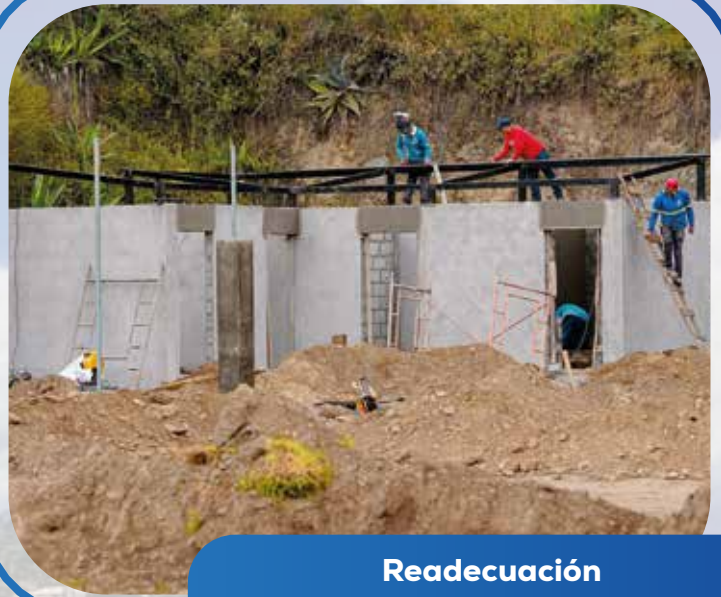
Readecuación estadio de Yataquí