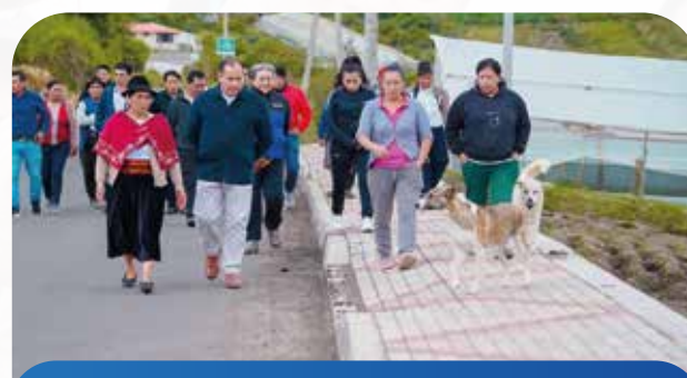
Construcción de aceras y bordillos Parroquia Chiquicha