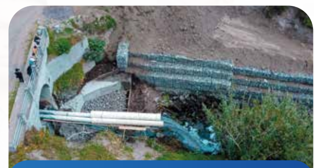
Muros de gaviones para estabilización Vía Sector Viñedos