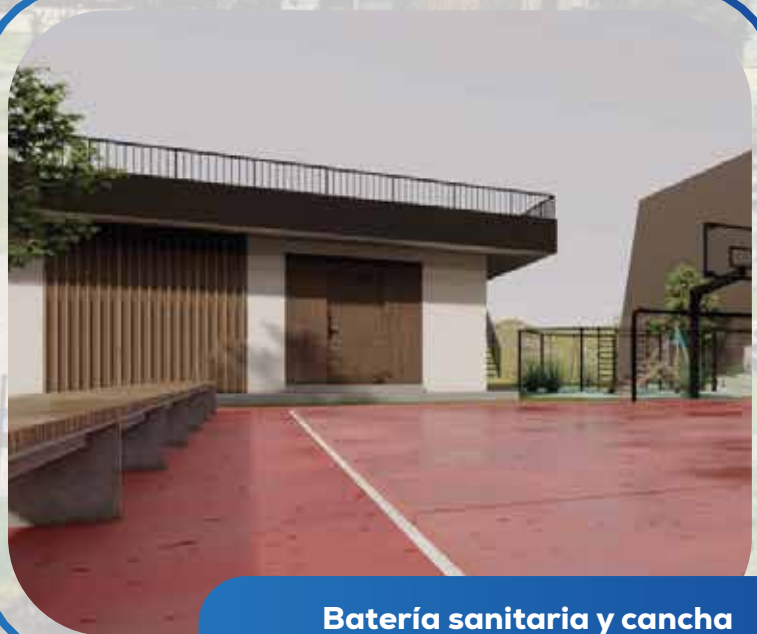
Batería sanitaria y cancha Plaza Viñedo Alto