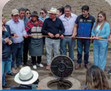
Construcción alcantarillado sanitario en García Moreno.

Chontapamba, Calle Marianitas, Guantugsumo y Ciudadela La Paz