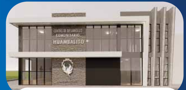
✓ CENTRO DE BIENESTAR PARA FAUNA URBANA DEL GAD M. PELILEO