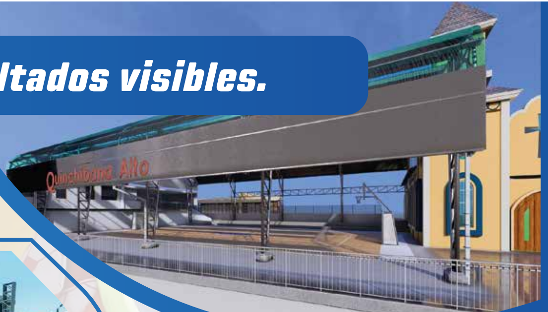
Construcción de cubierta de la cancha Quinchibana Alto

En Pelileo estamos dando pasos firmes con un grupo de obras que pronto iniciarán. Sabemos que cada proyecto es un proceso que toma tiempo, desde la planificación hasta su ejecución, y lo estamos haciendo con responsabilidad.