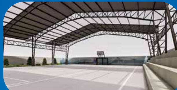
✓ CUBIERTA Y ESPACIOS RECREATIVOS HUASIMPAMBA BAJO