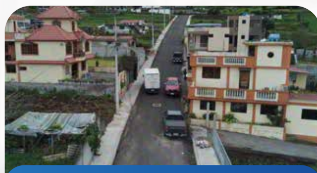
Construcción de aceras y bordillos Parroquia Bolívar