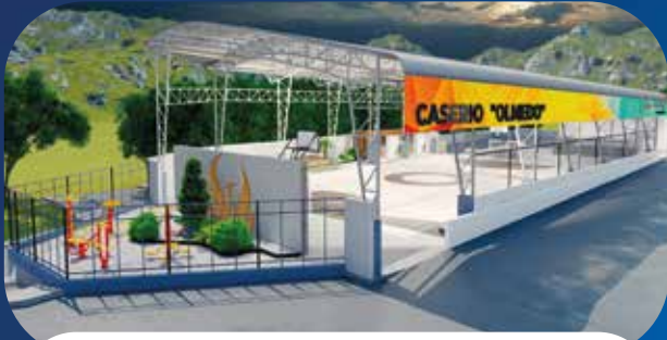
✓ CUBIERTA DE ESPACIOS DEPORTIVOS DEL CASERÍO OLMEDO

• INFRAESTRUCTURA • DEPORTE • BIENESTAR • DESARROLLO COMUNITARIO