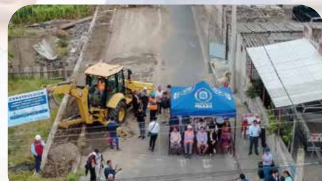
Construcción de aceras y bordillos Barrio Central y Barrio Oriente Pelileo Grande