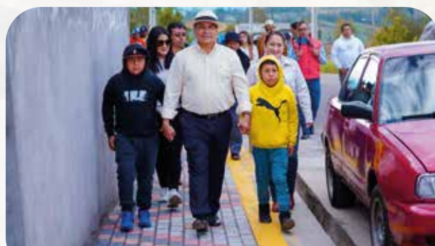
Construcción de aceras y bordillos Caserío Olmedo