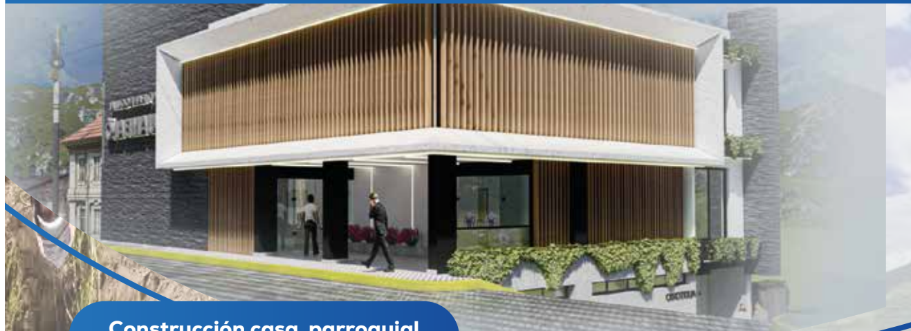
Regeneración urbana y construcción casa comunal parroquia Chiquicha