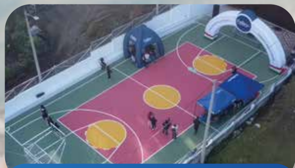
Cancha Deportiva Barrio La Unión