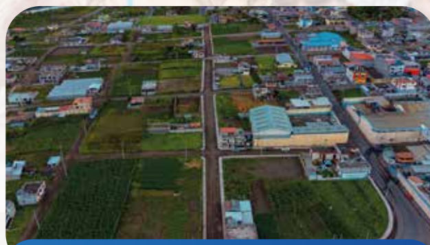
Mejoramiento del sistema vial Pelileo Grande

La construcción de aceras y bordillos en diversas comunidades de Pelileo refleja el compromiso de la Municipalidad con el bienestar y la seguridad de la ciudadanía. Estas obras mejoran la movilidad, ordenan el espacio público y brindan condiciones dignas para peatones y vecinos. Seguimos trabajando con responsabilidad y visión, porque la ciudadanía es nuestra prioridad.