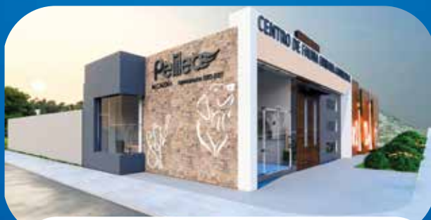
✓ CENTRO DE BIENESTAR PARA FAUNA URBANA DEL GAD M. PELILEO