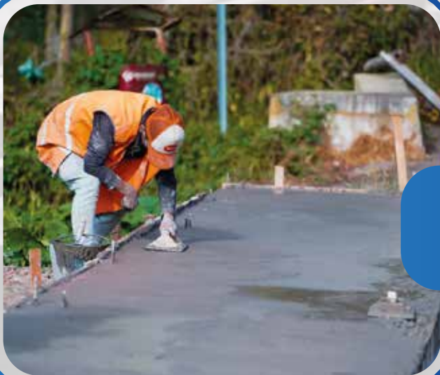
Aceras y bordillos en : Chambag Tambo El Progreso Benítez