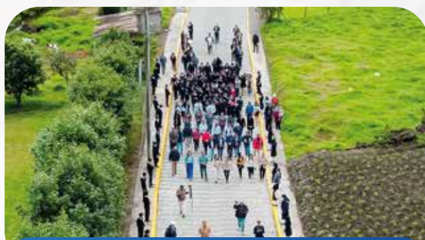
Mantenimiento y adoquinado decorativo Calle Magda Sánchez - Cotaló