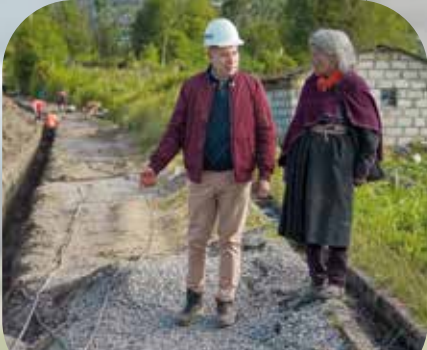
Construcción alcantarillado en la parroquia Salasaca