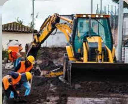
Redes de alcantarillado Varios sectores

Chontapamba, Calle Marianitas, Guantugsumo y Ciudadela La Paz