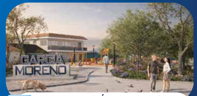
✓ REHABILITACIÓN PARQUE 26 DE MARZO Y ESPACIOS DE LA PARROQUIA GARCÍA MORENO