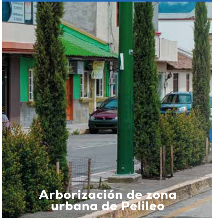
Arborización de zona urbana de Pelileo