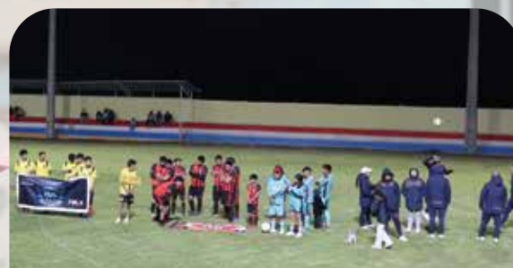
Construcción De Graderíos Estadio parroquia Bolívar