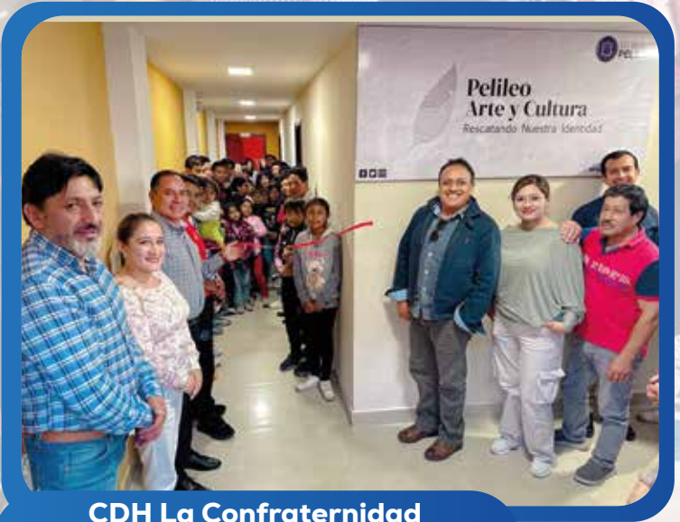
CDH La Confraternidad Remodelación de instalaciones para la Escuela permanente de Artes Pelileo